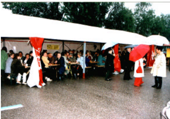
Nur der Himmel weinte, im Festzelt war die Stimmung gut