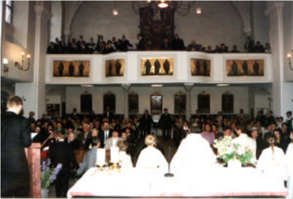
Festgottesdienst „Alle unter einem Dach“