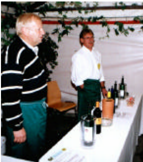
Die Festwirte in der Weinlaube