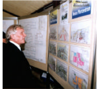
Präsentation des neuen Pfarrzentrums