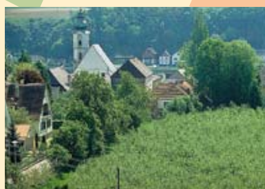
Blick vom Sierner auf Aschach