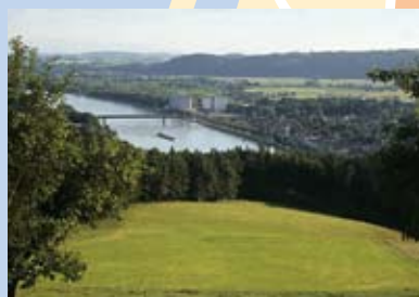
Blick vom Mühlviertel auf Aschach