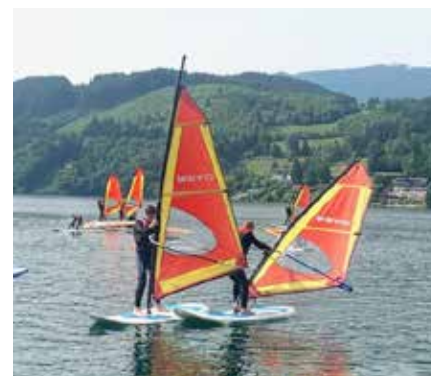
Erste Versuche im Windsurfen im Rahmen der Sportwoche am Millstättersee

Im Rahmen der Bildungs- und Berufsvorbereitung können sich die Schüler:innen bei verschiedenen Betrieben in der Region praxisnah über mögliche Karrierewege informieren