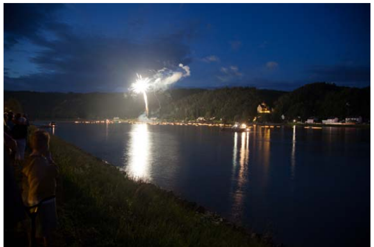
Fackelzug mit Feuerwerk